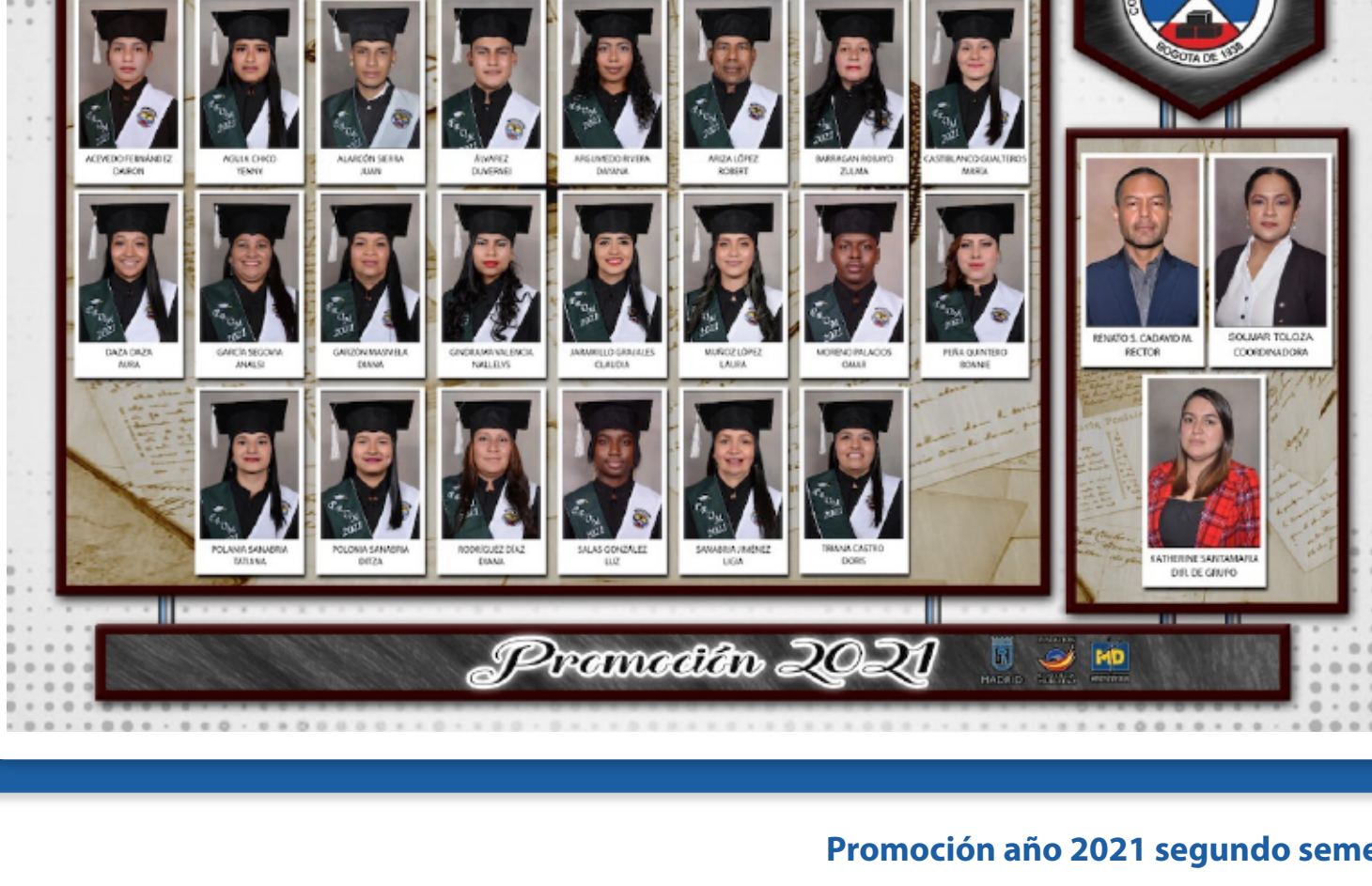
Promoción año 2021 segundo semestre