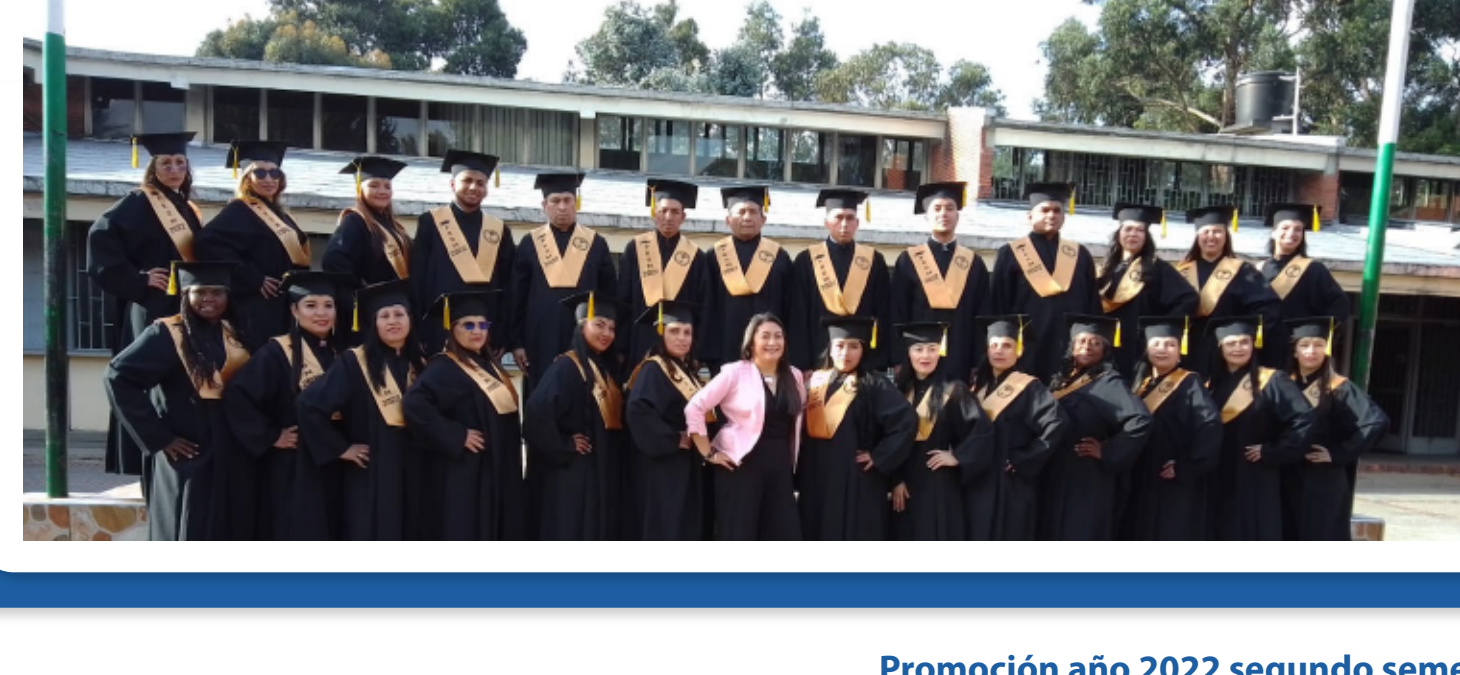
Promoción año 2022 segundo semestre